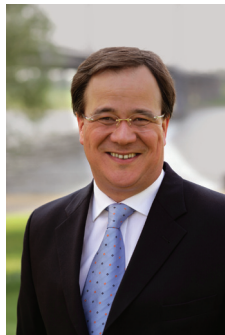
Schirmherr Armin Laschet Minister für Generationen, Familie, Frauen und Integration des Landes Nordrhein-Westfalen

Kreisberufskolleg Brakel Kongress 2010 Klöckerstr. 10 33034 Brakel